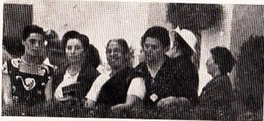
परदेशातील ' मॉन्टेसोरी ' पाहताना